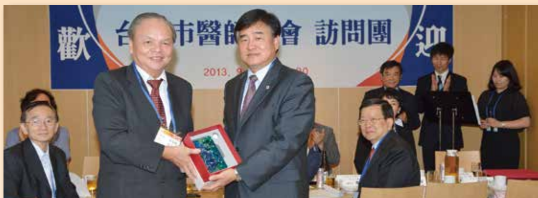
訪問姊妹會韓國首爾醫師會