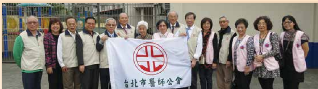
參訪育幼院並捐款