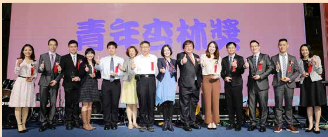
表揚青年杏林獎得獎醫師