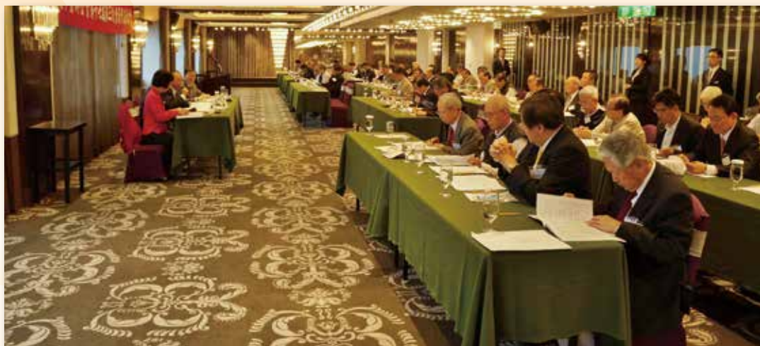
每年舉辦會員代表大會