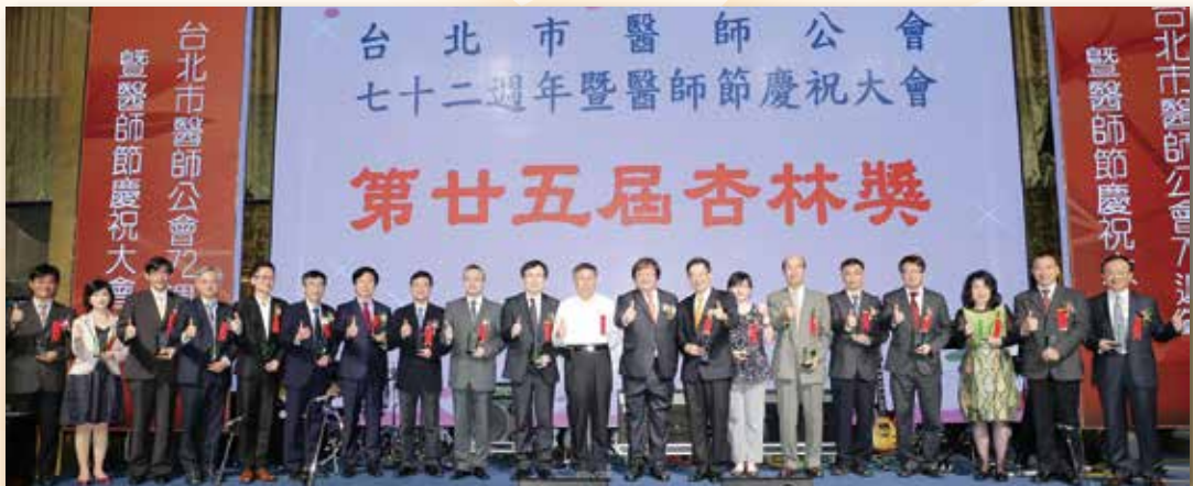
表揚杏林獎得獎醫師

由理事長召開，會中表揚卅年至七十年之資深醫師及杏林獎、住院醫師青年杏林獎好書獎得獎醫師。