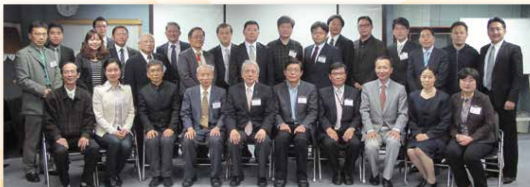
本會與南京市東南大學舉辦醫法交流座談會

03月16日 舉辦與南京市東南大學法學院、臺北大學法律系、銘傳大學法律系、國巨法律事務所、聯合醫事法律研究中心及新北地方法院檢察署等相關單位之醫法交流座談會。