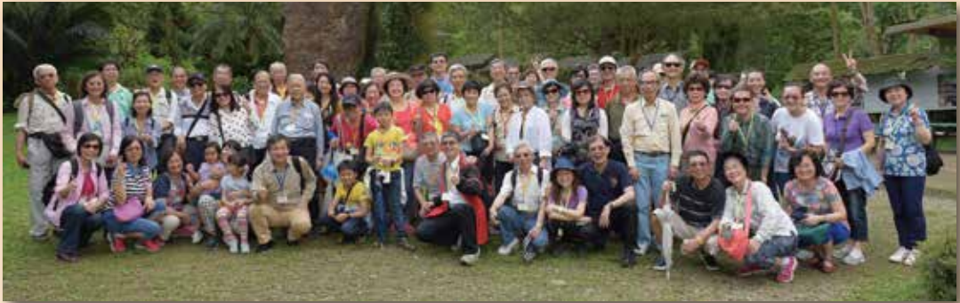
每年舉辦會員旅遊活動