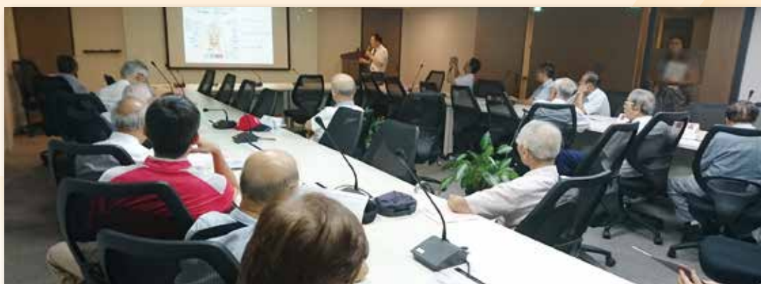
舉辦醫師健檢與民衆健檢研討會