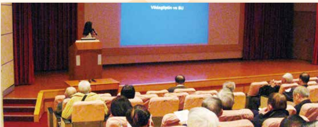
注重醫師的再教育，每星期舉辦學術講習