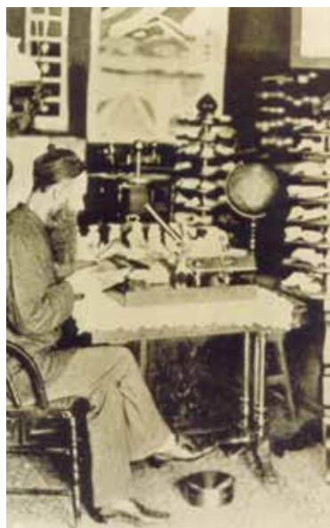
圖一 馬偕博士在自己家中的研究室。

馬偕傳記的作者，會因為誤會而寫出這段錯誤的報導，並不是很離譜之事。以後看到書中這故事的幾位醫師、歷史學家或教會史專家，也沒懷疑地轉載這故事，因為他們都知道，馬偕是很有科學研究精神者，因為知道馬偕好學及喜歡研究，沒人懷疑這研究可能不是馬偕而是別人的研究工作。馬偕家中就收藏很多各類生物及礦物標本，家中有私人「博物館」，他們更知道他的研究精神。日本統治台灣後，曾有位日本總督去馬偕家訪問他，對他的私人博物館的收藏及他的研究很驚訝，後來還派人去拍照馬偕私人博物館及收藏。