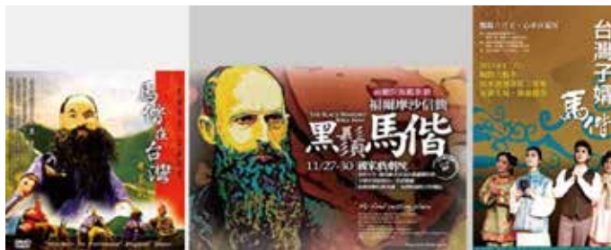
圖四 三種（歌劇、布袋戲及歌仔戲）表演藝術出版品(CD)的封面。

同時對女性的教育，馬偕及夫人是開端者。早在1884年就創建淡水女學堂，台灣第一所女子學校，以原住民及平埔族婦女開始，以後才有漢人女性加入。教授閱讀、寫字、算