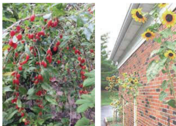
圖三 種出的枸杞及太陽花。

願意主持園藝專欄。忘了怎麼回答，想自己對園藝不是專家，只是從事學術醫學者，比較有的探討精神，多去探討以及多寫些文章而已。比起一些更熱心或更專業人士，還是差多了。自己時間又不多，想大概回答說不敢當。不久中國時報的美國版停刊，這業餘探討精神的園藝機遇，還是有可吹噓的話題，可真料想不到。