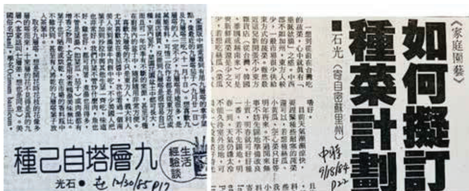
圖二 投稿登出的作品的例子。