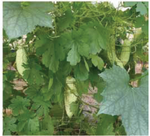
圖一 後院菜園茂盛及白玉苦瓜。

雖然仍要值班，以後有新來的同事分擔，比以前有更多的業餘時間。最近寫過兩篇有關的拙文〈種瓜何只得瓜；還得到更多〉及〈綠拇指、園藝樂、種菜經及太陽花〉 2,3 。那兩文就說園藝嗜好，改變了自己的生涯。