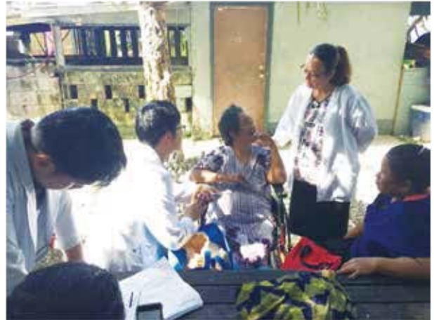
團隊參與家訪實況，進行完整的病史詢問、身體評估與處方衛教