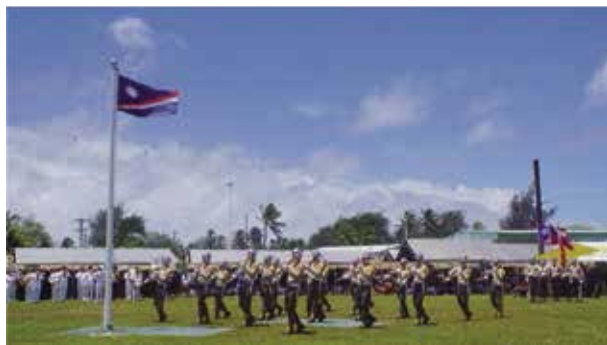
2019年適逢馬國建國40周年，我國敦睦艦隊儀隊於國慶典禮表演實況

(或NP)、公衛護理師、物理治療師三位，分別負責臨床評估藥物處方與病患衛教、生命徵象暨血壓血糖量測與傷口照護、居家復健復能暨輔具評估。其中物理治療師是過去未包含於團隊中的成員，但事實上對失能病患生活功能回復至關重要，簡單的復健活動或輔具介入，可能都對預後產生莫大影響。團隊從檢驗數據證明，運作良好的家訪計畫確實能顯著改善失能病人的慢性病照護，並期待在未來延緩失能繼續進展，更實地帶著NP參與團隊家訪，觀摩我們如何評估病患與調整藥物，一同討論未來治療追蹤計畫，懇求他們在臺灣醫師返國後能延續居家訪視一堪稱是馬國失能病人的最後醫療命脈。而過去醫院公衛部門家訪個案來源多來自口耳相傳也未定期更新，團隊也建議醫院應有系統的建置跨科橫向轉介機制：失能病人不論是因內科（中風）或外科原因（截肢、骨折）住院，住院時若曾照會床邊物理治療，出院返家後該科或物理治療師也應將名單轉介予公衛部門家訪團隊，繼續進行慢性病追蹤與復