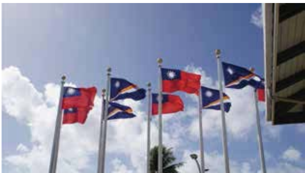
蔡英文總統於2019年3月出訪馬國時，下榻飯店外飄揚的兩國國旗

(或NP)、公衛護理師、物理治療師三位，分別負責臨床評估藥物處方與病患衛教、生命徵象暨血壓血糖量測與傷口照護、居家復健復能暨輔具評估。其中物理治療師是過去未包含於團隊中的成員，但事實上對失能病患生活功能回復至關重要，簡單的復健活動或輔具介入，可能都對預後產生莫大影響。團隊從檢驗數據證明，運作良好的家訪計畫確實能顯著改善失能病人的慢性病照護，並期待在未來延緩失能繼續進展，更實地帶著NP參與團隊家訪，觀摩我們如何評估病患與調整藥物，一同討論未來治療追蹤計畫，懇求他們在臺灣醫師返國後能延續居家訪視一堪稱是馬國失能病人的最後醫療命脈。而過去醫院公衛部門家訪個案來源多來自口耳相傳也未定期更新，團隊也建議醫院應有系統的建置跨科橫向轉介機制：失能病人不論是因內科（中風）或外科原因（截肢、骨折）住院，住院時若曾照會床邊物理治療，出院返家後該科或物理治療師也應將名單轉介予公衛部門家訪團隊，繼續進行慢性病追蹤與復