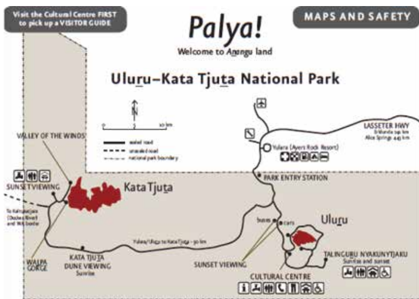
圖一：國家公園地圖，包含烏魯魯以及風之谷，上面也詳細的標注適合看日出日落的地點

雖然開車只需3小時便可以到達，但廣大的砂岩壁以及壯觀的景色都需要至少半天以上的時間好好體驗，因此多半會選擇在此地的旅館住宿一