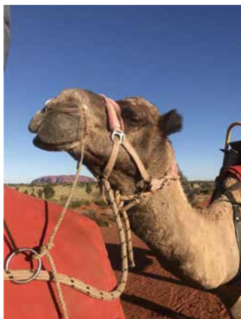
圖四：騎駱駝眺望艾爾斯岩

強烈推薦選擇日出或日落的tour，騎完之後搭配一杯氣泡酒觀賞，身心都充滿著震撼。