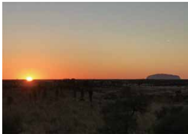
圖六：最美的日出，艾爾斯岩的時刻顏色變化跟一覽無遺的日出景觀