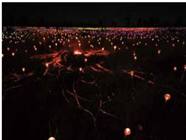
圖五：Field of Light:大型燈光裝置藝術

在一片寂靜中，隨著燈光變化外，抬頭仰望的星空是未加工的天然主角。在北半球的我們陌生的南十字座、半人馬座以及依舊閃耀的獵戶座，奇妙的是阿南古族都沒有述說這些星座的故事，反而紀錄了我們稱為昴宿星雲的七姊妹的故事。