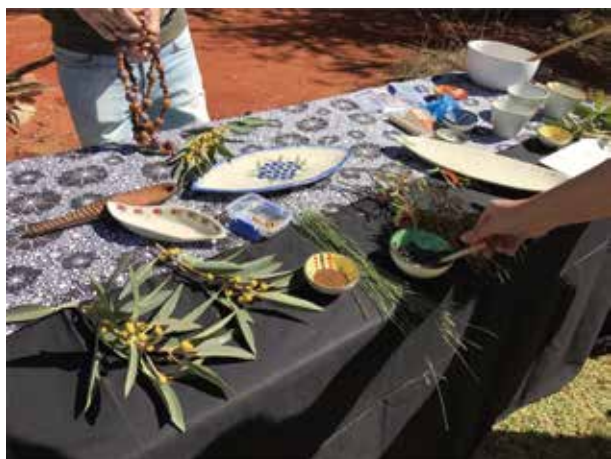
圖三：荒野食物介紹，黑藍色的是漿果做成的果醬，有巧克力及藍莓的味道